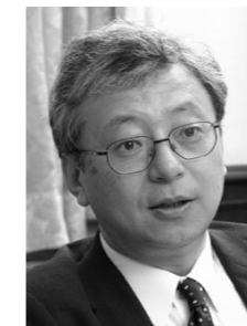
東京大学大学院経済学研究科 教授 (財)総合研究開発機構(NIRA) 理事長 講師 伊藤 元重 氏

経済学、ビジネスに関する多数の著書があり、テレビ東京「ワールドビジネスサテライト」のコメンテーター、日本経済新聞への寄稿など、素人にもわかりやすい切り口で経済学や最新のビジネス動向について論説する日本を代表するエコノミスト。